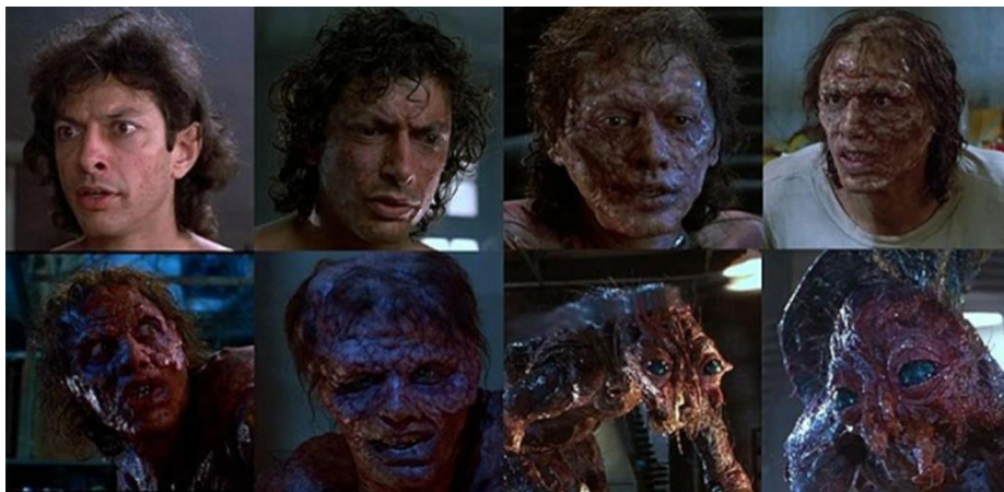
Jeff Goldblum A légy ( The Fly ) című filmben